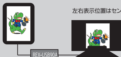
●タテ長表示モード