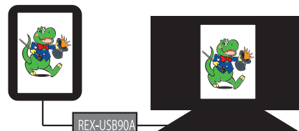
●タテ長表示モード